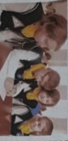
Дети участвуют в конкурсе рисунков

В рамках образовательной программы «Дорожная наука» в Севастополе проведены занятия для детей и родителей. Дети узнали о правилах дорожного движения и получили памятки на тему «Правила дорожного движения». Также дети посмотрели мультфильм «Правила дорожного движения» и получили призы за участие в конкурсе.