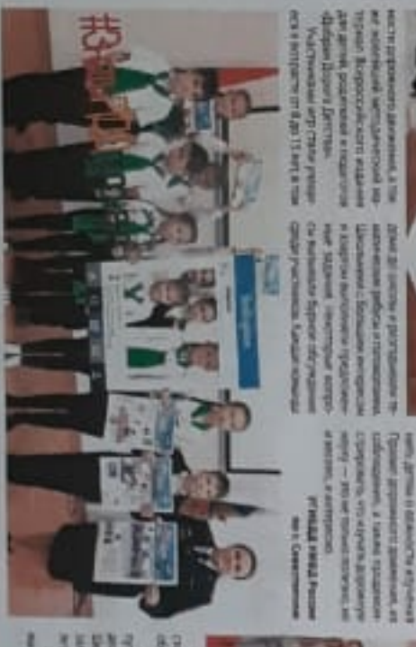
Дети получили памятки на тему «Правила дорожного движения»

В рамках образовательной программы «Дорожная наука» в Севастополе проведены занятия для детей и родителей. Дети узнали о правилах дорожного движения и получили памятки на тему «Правила дорожного движения». Также дети посмотрели мультфильм «Правила дорожного движения» и получили призы за участие в конкурсе.