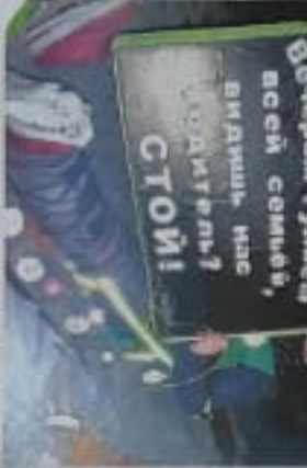
В Севастополе обучают детей правилам дорожного движения

Воспитатели группы и родители подготовили для детей и родителей презентацию «Правила дорожного движения» и провели конкурс рисунков «Правила дорожного движения». Дети рисовали рисунки на тему «Правила дорожного движения» и получили призы за участие в конкурсе. Также дети посмотрели мультфильм «Правила дорожного движения» и получили памятки на тему «Правила дорожного движения».