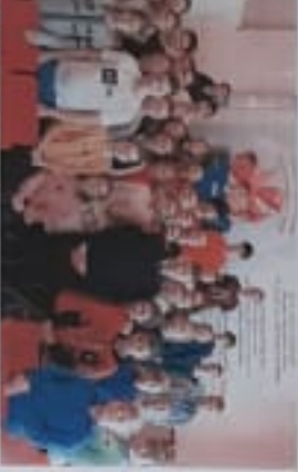
Дети получили памятки на тему «Правила дорожного движения»

В Приморском крае проведены занятия по безопасности вблизи железной дороги