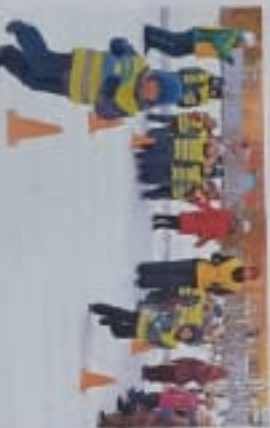
Дети получили памятки на тему «Правила дорожного движения»

В Республике Татарстан проведены занятия по безопасности в зимнее время