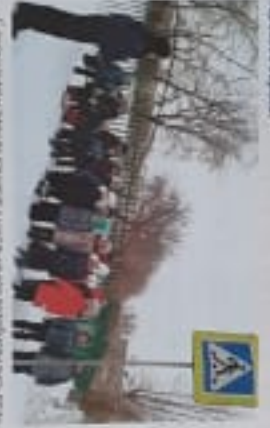
Дети получили памятки на тему «Правила дорожного движения»

После летних каникул в Севастополе проведены занятия по безопасности