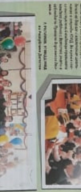
Дети получили памятки на тему «Правила дорожного движения»

В Республике Дагестан проведены занятия по безопасности