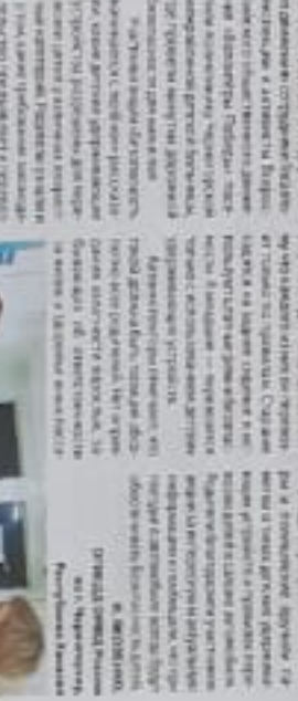
Дети получили памятки на тему «Правила дорожного движения»

В Республике Хакасия проведены занятия по безопасности для родителей